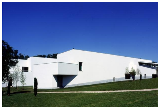
Imagem 01 – Casa de Serralves/ Imagem 02 – Museu de Serralves

O Museu de Arte Contemporânea de Serralves não se compreende sem a paisagem que o envolve e lhe dá sentido. Na verdade, o edifício integra uma vasta quinta, unificada e reestruturada nas décadas de 1920 e 1930, para servir de residência, no Porto, ao segundo Conde de Vizela. O conjunto vive, assim, não apenas da sua casa, desenhada em inspiração decó , mas também de alamedas, clareiras e parterres , implantados em diferentes tempos. (...) Adquirida pelo Estado, a quinta foi convertida em 1989, em sede da Fundação de Serralves – instituição destinada a criar um pólo museológico de arte contemporânea na cidade – prevendo-se, então, a construção, de raiz, de um novo edifício. Coube ao Álvaro Siza projectá-lo, estabelecendo um diálogo com a memória da casa e da paisagem preexistentes (GRANDE, 2009, p. 58).