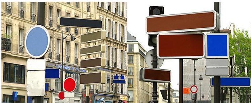
Figura 6 - Gaio Matos (1971)

O artista justifica que a cor, em especial sobre as placas de sinalização, “retira a obrigação do olhar e do corpo em relação ao espaço da cidade, interfere no tempo, nos sentidos e propõe a subjetividade em lugar de uma ordem pré-estabelecida” (MATOS, 1 dez. 2016).