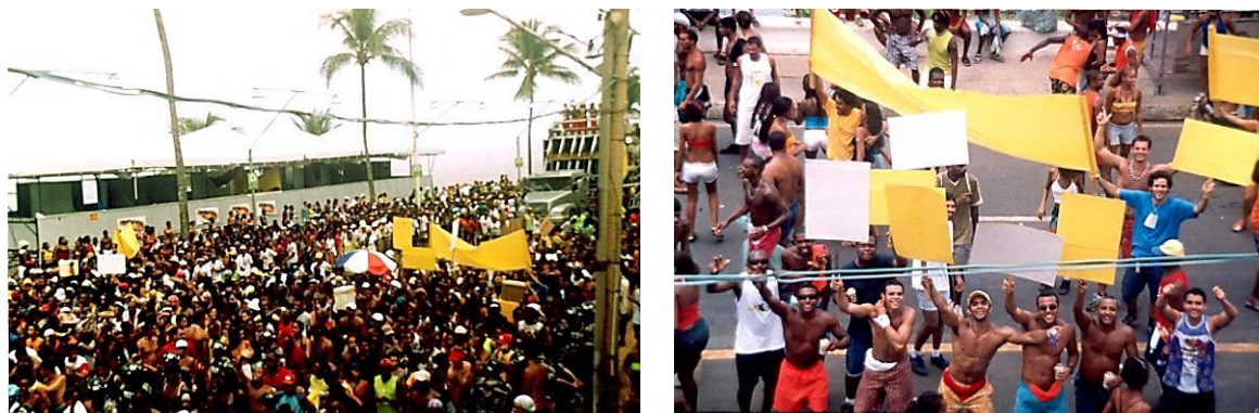
Figuras 3 e 4 - GIA. Não propaganda , 2003 Intervenção no carnaval de Salvador em 2003 com cartazes e faixas Dimensões variáveis.