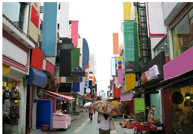
Figura 7 - Gaio Matos (1971)