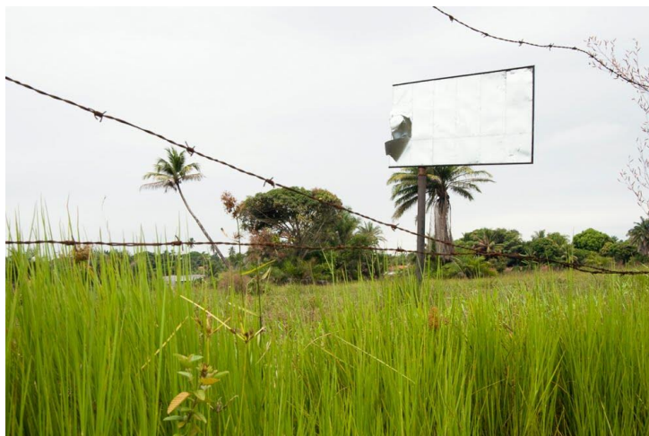
Figura 10 - Péricles Mendes (1976) Obra da série Subtraídos , [2010] Disponível em: < http://grupoartehibrida.blogspot.com.br/2011/08/pericles-mendes.html > Acesso em: 20 fev. 2017

Face ao exposto, podemos inferir que o pseudomorfismo se caracteriza por uma determinada configuração ou forma ser aceita em um contexto diferente da sua conjuntura original sem, todavia, ser fruto de intencionalidade do artista, no sentido de utilização consciente de formas pré-existentes, diferentemente de um procedimento regular de apropriação, onde o uso de imagens anteriores é consciente e intencional, servindo a propósitos diferenciados do contexto original, razão pela qual concluímos ser o pseudomorfismo oposto à apropriação de imagens. Podemos, todavia, falar da existência de uma relação pseudomórfica entre dois períodos históricos (o de Fred Forest, em um primeiro momento, e GIA, Gaió Matos e Péricles Mendes, em segundo) ou em relação a artistas do mesmo período que a tenha praticado sem intencionalidade, sem isso implicar em apropriação de imagens, tampouco significar que o artista atual conheça o trabalho do artista pregresso e praticar plágio.