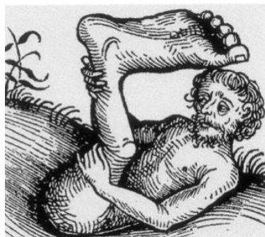
Figura 1 - Representação de cefalópode, em Crônica de Nuremberg , século 15 Milão, coleção particular Fonte: ECO, 2004, p. 140