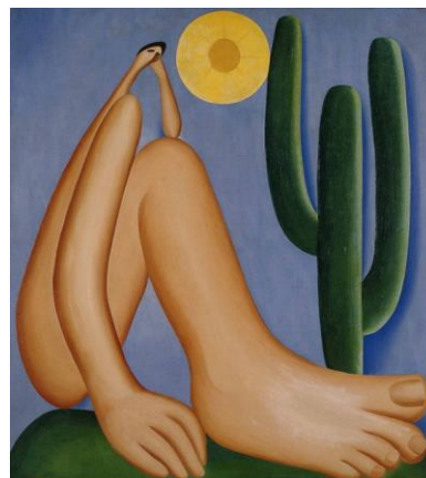
Figura 2 - Tarsila do Amaral (1886-1973) Abaporu , 1928 Óleo sobre tela, 85 x 73 cm Coleção Eduardo Constantini, Buenos Aires. Fonte: RIBEIRO, 2013, p. 85