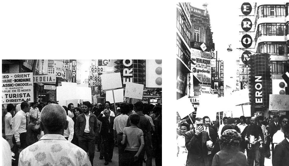
Figuras 8 e 9 - Fred Forest (1933)

O que se pode apontar como pseudomorfismos em algumas ações da Não propaganda , do GIA – tal qual a passeata no carnaval, ou o vídeo gravado em área comercial de São Paulo em 2006 – e a ação de Gaio Matos com Silence , é considerar as estratégias e aparências destes trabalhos em relação a uma outra ação, promovida por Fred Forest em 1973, em São Paulo, intitulada O branco invade a cidade (Figuras 8 e 9).