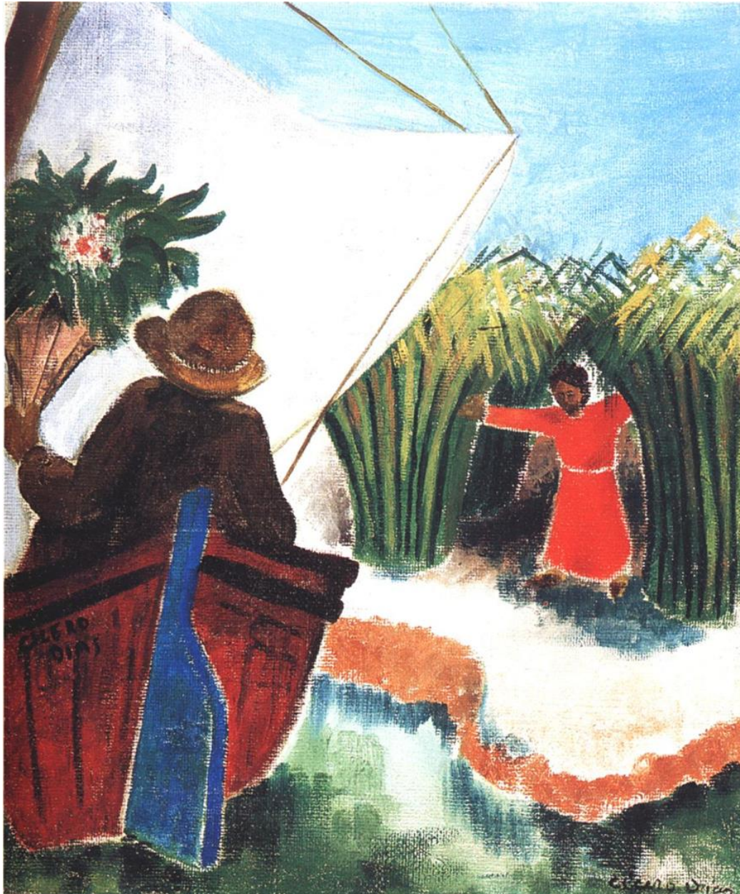
Cícero Dias, Canavial e barco, 1934, óleo s/tela, 56 x 46 cm

mesmo das casas, das cores, ao homem e a paisagem. É por isso que eu acredito no estilo pernambucano" 8 .