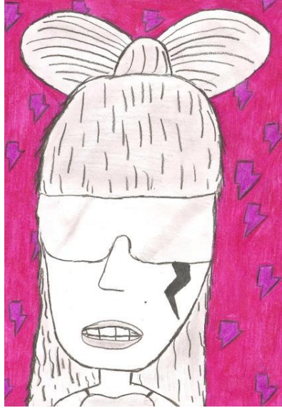
Figura 1: Luís Otávio, 13 anos, “ Lady Gaga ”, escola pública estadual, 2011. No desenho acima as características físicas da cantora são representadas pelo penteado, os óculos e a maquiagem. O exagero cômico é pouco utilizado.