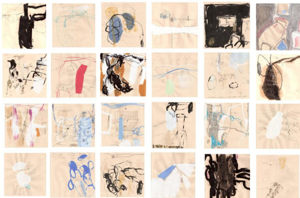
Fig. 01. Reservatório lápis de cor, tinta guache, acrílica e óleo sobre papel, 23 x 23 cm (cada desenho), 2008-2010.

A cada nova elaboração e montagem da série dos Reservatórios (fig. 02) podem estar repetidos alguns desenhos, mas suas colocações serão sempre movidas pelo lugar, pelo espaço expositivo e pelas relações internas que eles podem proporcionar. As instaurações, ou seja, os diversos movimentos e trajetórias que formam e transformam o trabalho, suas cisões, rupturas são, segundo Paquet (2004), como cicatrizes que deixam indícios das modulações temporais do trajeto, com todas as suas marcas e características. Assim, cada gesto ou cada desenho novo remete a outros anteriores, num percurso em que o repetir conduz à experiência e ao desejo de retomar, de apreender algo de um estado inapreensível e almejado. Para Benjamin, “[...] toda e qualquer experiência mais profunda deseja insaciavelmente, até o final de todas as coisas, repetição e retorno, restabelecimento da situação primordial da qual ela tomou o impulso inicial” (2002, p. 101).