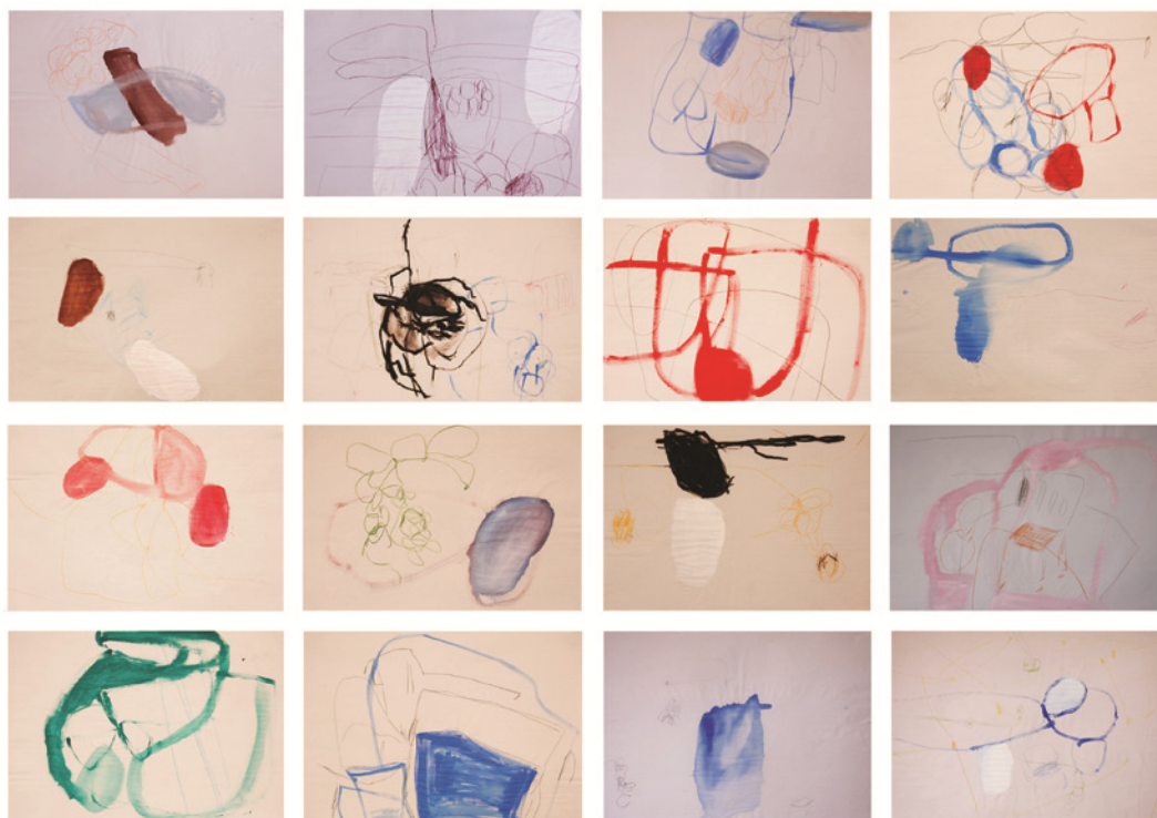
Fig. 02. Reservatório, lápis de cor, tinta guache e óleo sobre papel camurça, 40 x 60 cm, (cada desenho), 2009-2011.