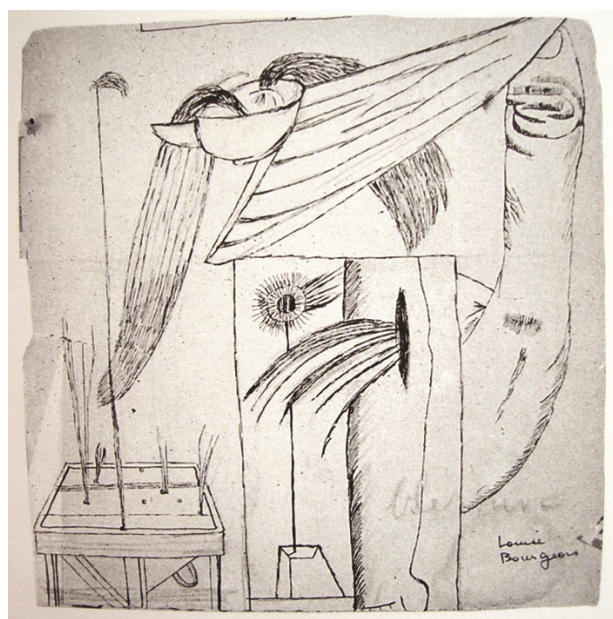
Fig. 04. Louise Bourgeois, sem título, tinta sobre papel, 1947.