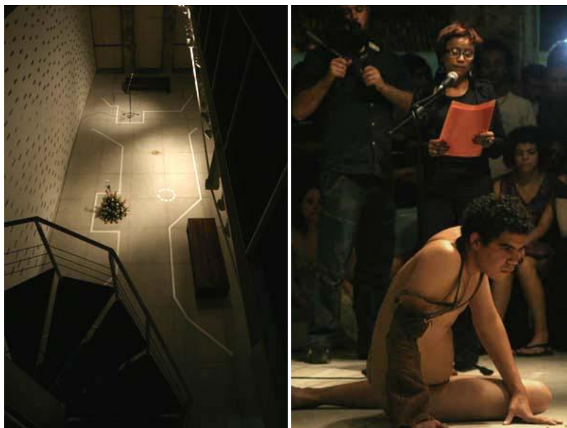
Fig.2 – Performance Todo Homem tem direito a terra , realizada em 2006 no MAMAM do Pátio, em Recife-PE. Imagem disponível em: http://www.polemica.uerj.br/pol17/cimagem/carlos_melo2.jpg .