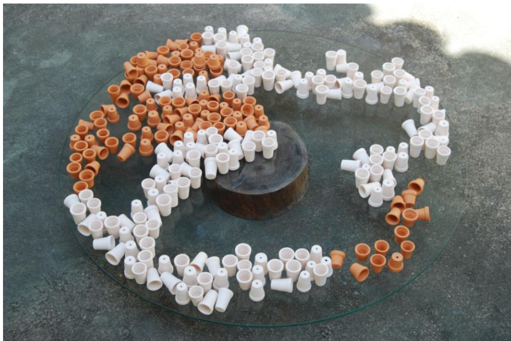
Terra , 2009, processo de montagem

Depois espalhei os caxixis alaranjados, terracotas, que imediatamente me lembraram a cerâmica de forma ampla - terra cozida - tijolos, telhas, potes, olarias, casas, cidades inteiras, todo nosso mundo habitado. E conectei-me à rede cultural mais uma vez, com as palavras metafóricas do Professor Dante Galeffi 3 , que, em um de seus ensaios nos fala: “Assim, se poderia até dizer que o universo e a vida no planeta Terra são uma grande olaria em que são elaboradas as formas existentes.”