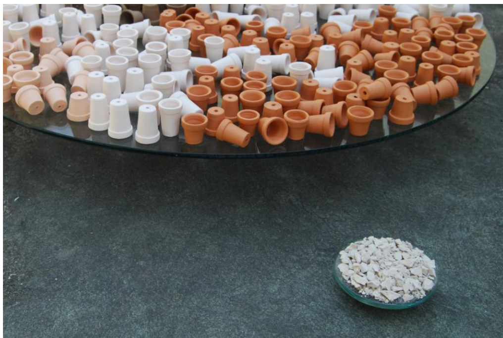
Terra , 2009, processo de montagem

Dessa maneira, numa ação lúdica e com uma boa quantidade de caxixis, mínimas expressões humanas cerâmicas, chegou-se ao máximo do espaço ocupado pelo homem - a Terra... Então pensei: será que o homem pode interferir no máximo com um mínimo? Qual a consequência de seu gesto?