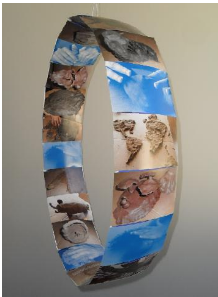
Fotografia da montagem de imagens registradas na oficina Qual sua imagem da Terra?

Também refleti sobre os comentários feitos pelos participantes na busca por compreender suas ações expressivas em atividade criativa e digo que não discordo de nada, acho mesmo que interagimos com nossas colocações, com todas as imagens pessoais e coletivas e nos recompomos a todo o momento. Por isso organizei as fotografias das imagens modeladas na referida oficina numa montagem circular com visão de uma face interna e outra externa, onde busquei sintetizar o movimento dinâmico, ininterrupto, que experienciamos no dia a dia de uma construção e reconstrução de nossa visão de mundo interior que dialoga com nossas percepções de nosso entorno.