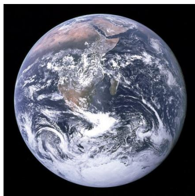
Fotografia da Terra tirada em 1972, pela tripulação da nave espacial Apollo 17.

chegando-se à concepção de corpo esférico que percorre uma órbita elíptica em torno do Sol até sua completa revelação através da imagem fotográfica colorida e inteira, tirada em 1972, pela tripulação da nave espacial Apollo 17. Hoje, conhecemos a Terra como ela é, a bolinha azul, o planeta azul, e temos em nossa memória um sem número de registros de imagens parciais, de cada lugar onde estivemos, ou também não estivemos e reconstruímos a partir de cartões postais, filmes, livros, etc.