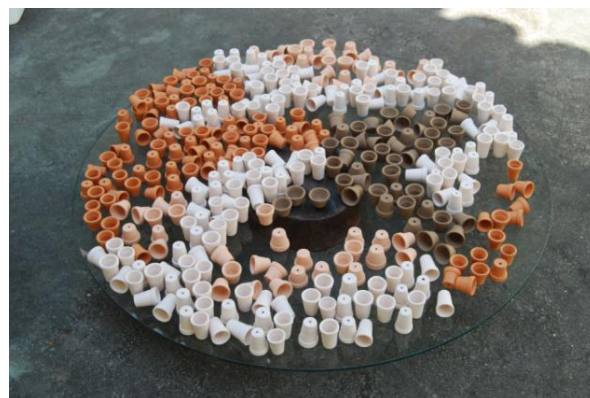
Terra , 2009, processo de montagem