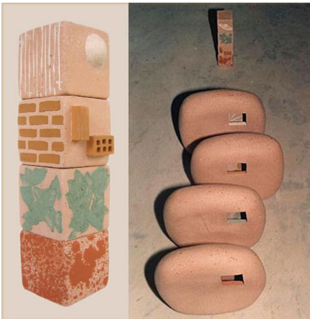
Ponto de vista , 1991

cores e formas inerentes à cultura baiana, dialogando com pessoas significativas para mim – minha família, tema abordado em obras anteriores como Ponto de vista , 1991. Observando os olhares diferenciados de cada um de nós do grupo familiar: pais e um casal de filhos, na época, tomei como motivo da obra esses pontos de vista, e os registrei em pequenos cubos que se desprenderam do interior dos quatro módulos e que estavam estreitamente ligados à personalidade de cada um: