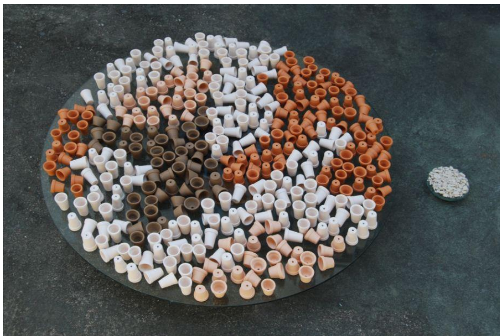
Terra , 2009, 400 caxixis, vidro, madeira, fragmentos de terra cozida, 105 x 80 cm.

trago nesta obra, brinquei em minha infância. São, portanto, peças de grande importância em meu imaginário.