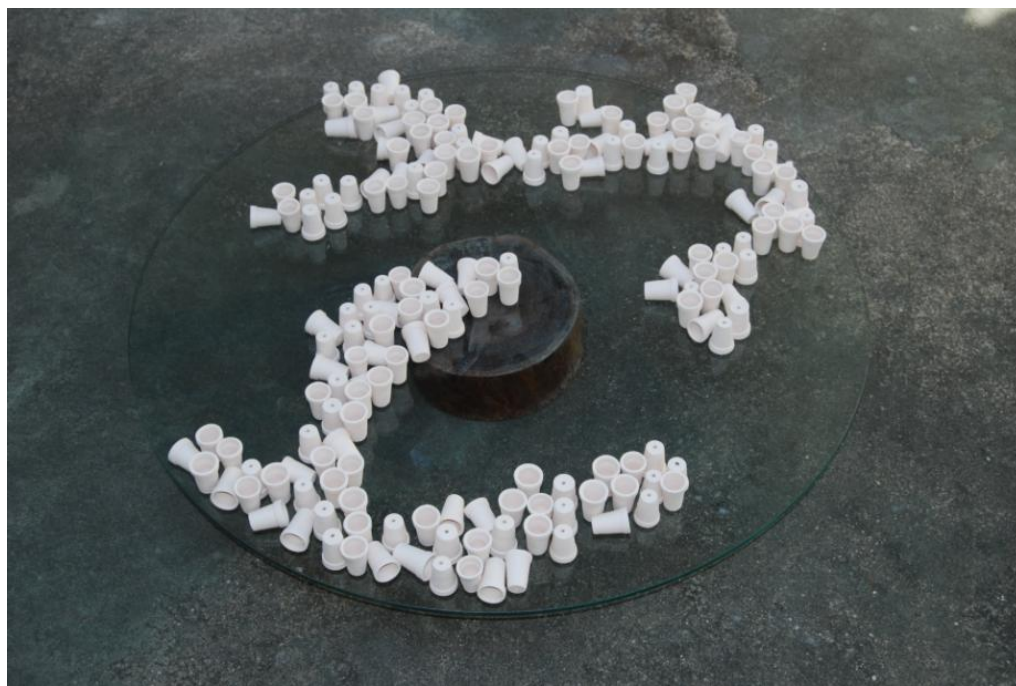
Terra , 2009, processo de montagem

Já em 2009, testando sua montagem, comecei derramando e espalhando os caxixis brancos sobre o vidro, por sua vez apoiado na fatia de tronco de sucupira. No momento, recordo que busquei na memória as nuances das cores – verdes, azuis, e tons terrosos - que definem as áreas sólidas e líquidas de nosso planeta e procurei diagramar os caxixis em movimentos semelhantes, fazendo assim também referência a espaços geográficos amplos, talvez mares, talvez cordilheiras, ou ainda nuvens que a circulam, nada muito definido, sem, contudo, esquecer alguma diversidade, alguma especificidade, nos posicionamentos das pequenas peças, ora voltadas para cima ou para baixo, apontando direções contrárias, etc.