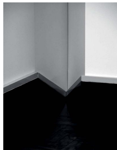
Espaços virtuais, cantos nº 4 1967-68, madeira, tela, tinta, piso de taco e madeira 305x100x100cm

Cantos-cunhas, como caminhos para as quinas, aquelas instâncias, situações nas quais se entra, se é apanhado, flagrado, como em vértices-vórtices nos Relevos Sensoriais de Hélio Oiticica – Penetrável, PN1, 1960, Invenção da luz, Invenção da cor, "Magic square 3", 1977 . N'aqueles Cantos (Hélio e Cildo) e N'Estes Cantos-Cunhas que nos habitam e neles habitamos, se instalam as vivências, as possibilidades de trans-pormos experiências artísticas para a vida cotidiana e compartilhada com inúmeras multidões (Toni Negri).