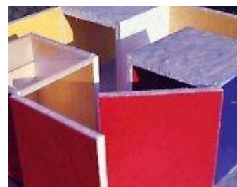
Invenção da cor, "Magic square 3", 1977 maquete para penetrável, Nova Iorque