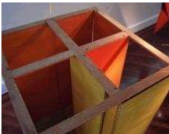
Penetrável, PN1, 1960 óleo sobre madeira

Cantos-cunhas, como multidões , um todo de singularidades. A multidão sempre em movimento, se constitui e constitui a sociedade produtiva e, cooperação social para a produção. Multidão é um conceito de potência, tornar corpo. É um agente social ativo, uma multiplicidade que age, não uma unidade como povo que nós vemos como algo organizado. É, de fato, um agente ativo, de auto-organização; trabalho cooperativo, vivo, político. As origens do discurso de multidões são encontradas no pensamento de Spinoza: nunca poderemos saber aquilo de que um corpo é capaz. Multidão é o nome da multidão de corpos. Cada corpo é uma multidão, interceptando a multidão, cruzando a multidão com a multidão, corpos se tornam misturados, híbridos, transformados, mestiços. Eles são sempre como ondas do mar, em perene movimento e transformação recíprocas. O corpo é trabalho vivo, portanto expressão e cooperação, construção material de mundo e história. A multidão é a multidão de corpos. Tentar estar em “estados de cantos”, é tentar dar corpo – corpar – esta multidão e multidões n’ele ativadas. É tentar acampar de ilha em ilha no oceano. Corpar a “potenza conectiva” (Toni Negri dialogando com Spinoza) (FAVRE, Regina).