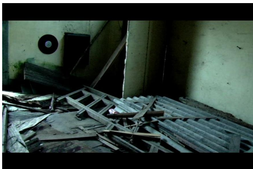
Didonet Thomaz e Isaac Benavides. Espaço provisório VII, VIII e IX , 2011. 3 fot.: color.; 7 x 11 cm.