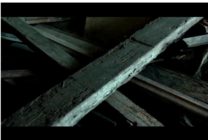
Didonet Thomaz e Isaac Benavides. Espaço provisório IV, V e VI , 2011. 3 fot.: color.; 7 x 11 cm.