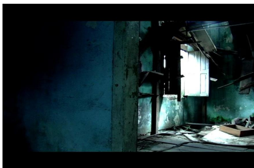
Didonet Thomaz e Isaac Benavides. Espaço provisório I, II e III , 2011. 3 fotogramas: color.; 7 x 11 cm.