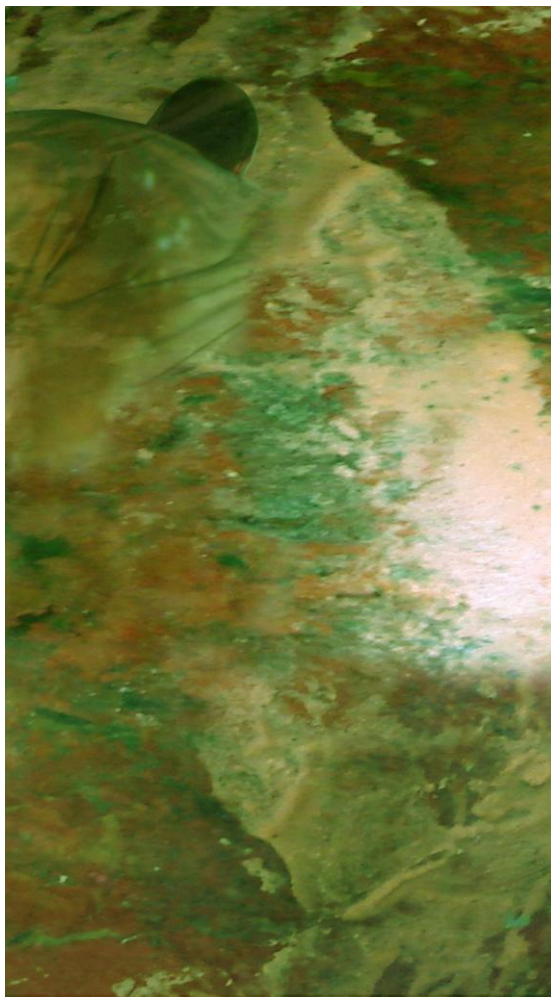
Numância . Performance-Ensaio, 2011.

Conforme estabelecem Deleuze e Guattari, é este o papel da arte, o de criar sensações, ou, como definem os dois filósofos, “um bloco de sensações, isto é, um composto de perceptos e afectos” (DELEUZE; GUATTARI, 1997, p. 213), conceitos inerentes, para eles, à questão mesma da arte. E esclarecem: