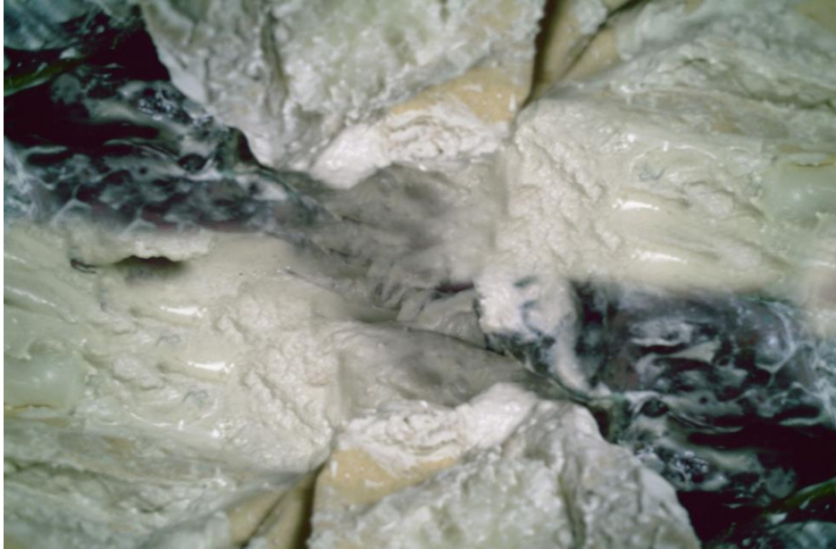
Numância . Frames de vídeo digital, 2011.

próprio para as manifestações de resistência a estados de exceção, que se tornam, cada vez mais, o ponto central de nosso interesse.