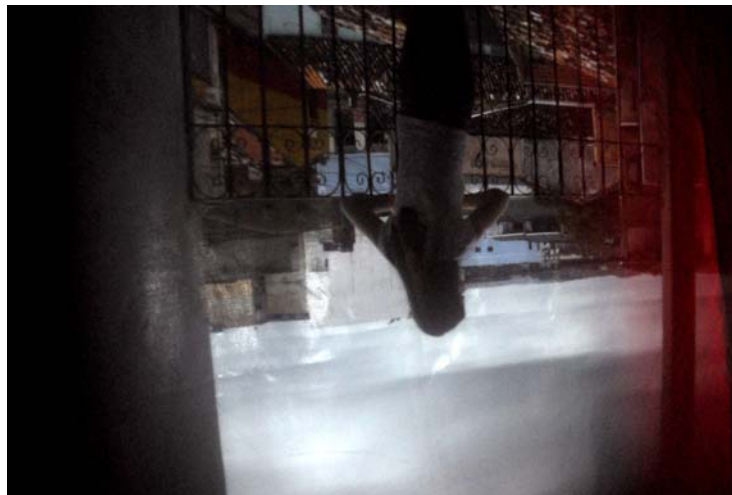
Figura 6. 1ª série de metafotografia (protótipo da tenda) – Mares, Península de Itapagipe, Salvador BA, Julho de 2008

Os primeiros experimentos híbridos de produção de imagem metafotográfica foram realizados lá: uma camera digital (Nikon D200) fotografando a imagem captada na tenda.