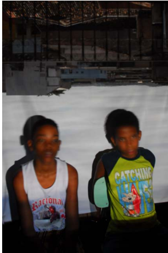
Figura 7. 2ª série de metafotografia (protótipo da tenda) – Mares, Península de Itapagipe, Salvador BA, Julho de 2008

Entusiasmados, os meninos cronometravam o tempo e fotografavam o “making of”. Semanas depois, ainda ouvíamos comentários entusiasmados e as reações incrédulas dos que não compartilharam a experiência.