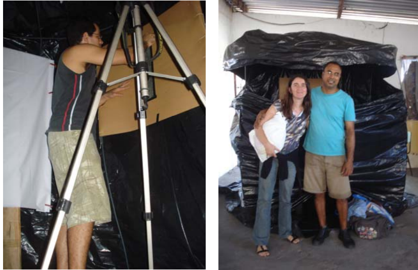
Figuras 4 e 5. Projeto Piloto – “Tenda dos Milagres” – Mares - Península de Itapagipe, Salvador BA, Junho de 2008

Os primeiros experimentos híbridos de produção de imagem metafotográfica foram realizados lá: uma camera digital (Nikon D200) fotografando a imagem captada na tenda.