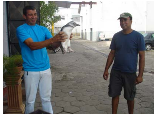
Figuar 8 e 9. . 3ª série de metafotografia (protótipo da tenda) – Ribeira, Península de Itapagipe, Salvador BA, Julho de 2008

Depois, tivemos de pensar outro modelo para a tenda, maior, mais fácil de montar, menos quente. Nossos apoios culturais têm vindo de moradores e pequenos comerciantes dos locais por onde passamos. Assim a Café Decorações, loja próxima à Escola de Belas Artes, ofereceu a lona para a confecção da nova tenda. Assim foi-nos possível participar do I Salão Arte e