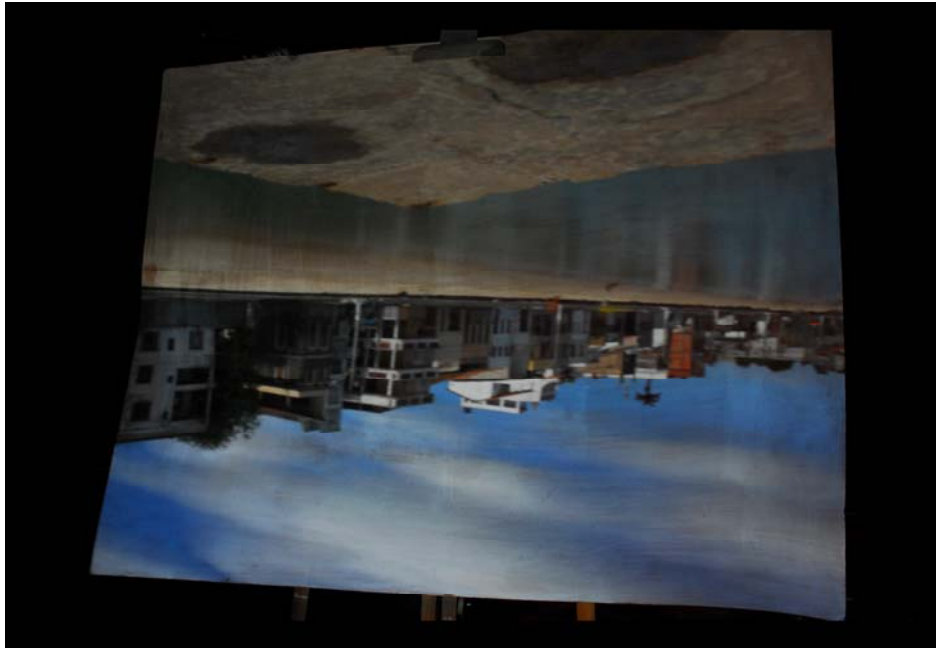
Figura 8. 3ª série de metafotografia (protótipo da tenda) –Ribeira, Península de Itapagipe, Salvador BA, Julho de 2008

Na medida em que montávamos a tenda, passantes e pescadores se envolviam. Alguns pensaram sermos do Ibama e nos apresentaram um dos pingüins que recentemente visitaram as praias da Bahia, nervoso enquanto aguardava resgate.