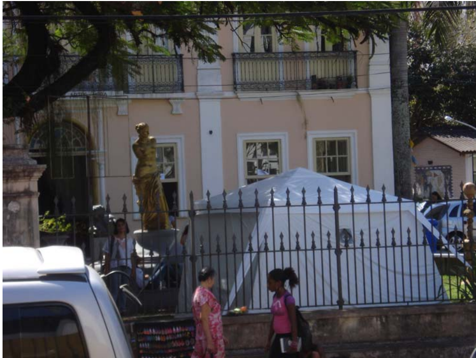
Figura 2. Tenda dos Milagres vista da Rua Araújo Pinho, Canela. I Salão Arte e Cidade. Escola de Belas Artes, Universidade Federal da Bahia, Salvador BA, Outubro de 2008

Às vezes somos inquiridos sobre o porquê investigar cameras obscuras hoje, mais de um século e meio depois do nascimento da fotografia, depois da incrível evolução técnica que esta arte atingiu e das duas grandes revoluções que produziu, o cinema e a imagem digital.