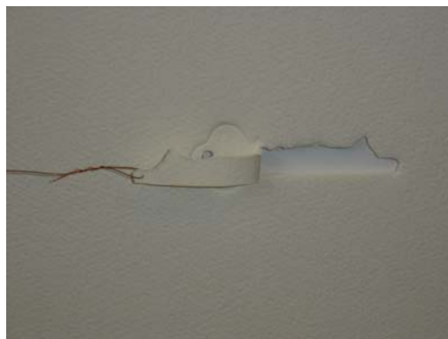
Fig.1 Desenho objeto: paisagem / Detalhe

No desenvolvimento do projeto O tempo como Matéria , a exposição será um grande desafio. Prevista para acontecer no primeiro piso do Museu de Arte Contemporânea de Niterói, o espaço deste museu, projetado por Oscar Niemayer, é formado por um grande salão circular limitado por cinco paredes e cercado por uma varanda. O edifício não tem divisórias ou salas. Poderíamos falar em um espaço de dentro e outro de fora. O interno, um “círculo” poliédrico com mais ou menos trezentos metros quadrados. O externo, uma varanda fechada com vidro e totalmente aberta à paisagem. Tais características arquitetônicas são determinantes, pois as obras inevitavelmente vão compartilhar o espaço, e mais do que isso, a articulação entre as obras será determinante na construção do trabalho coletivo.