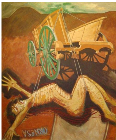
Medidas: 145x120cm, ano 2004, vertical. Técnica: óleo sobre tela. Título: “Deposizione: Sollevato per il trasporto”.

Pinturas da série “Anche lui va a Ornesa”.