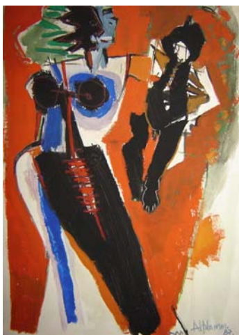
Medidas: 35,3x24cm, ano 87, vertical. Técnica: Guache sobre papel. Linguagem: Pintura.