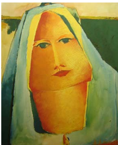
Medidas: 55x45,5cm, ano 1977, vertical. Técnica: óleo sobre tela. Linguagem: Pintura.