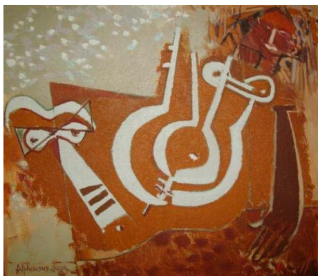
Medidas: 85x95cm, ano 2000, horizontal. Técnica: óleo sobre tela. Linguagem: Pintura.

As massas de tintas, misturadas com areia ou gesso, ganham força em seu trabalho. Vemos a textura como algo mais tátil do que visual. Há um convívio diferente entre áreas planas, trabalhadas ora com rodo e, em outras com espátulas, misturadas a áreas aquareladas e texturizadas também com o pincel. As obras tornam-se mais expressivas, a textura se torna um elemento importante para a obra.