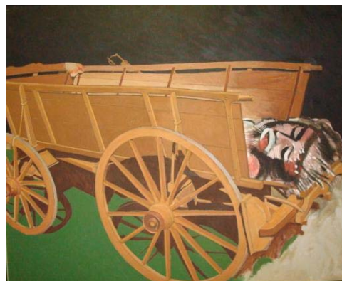
Medidas: 120x145cm, ano 2005, horizontal. Técnica: óleo sobre tela. Título: “Trasporto in carro da Buoi”.