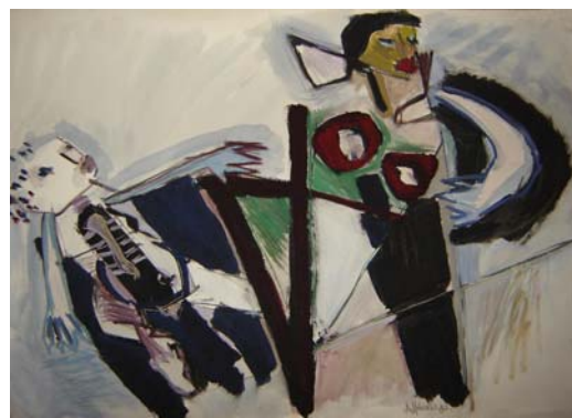
Medidas: 35x50cm, ano 87, horizontal. Técnica: Guache sobre papel. Linguagem: Pintura.

Nas obras seguintes, aparecem formas que se repetem na construção da figura feminina, são variações e estudos de um mesmo símbolo, buscando outras composições, como as formas da cabeça, seios e tronco. Esses signos, como Alphonsus denomina essas formas, não possuem um significado determinado, eles servem como apoio para uma pesquisa plástica, de composição e cor.