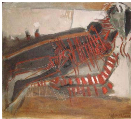
Medidas: 85x95cm, ano 2000, horizontal. Técnica: óleo sobre tela. Linguagem: Pintura.