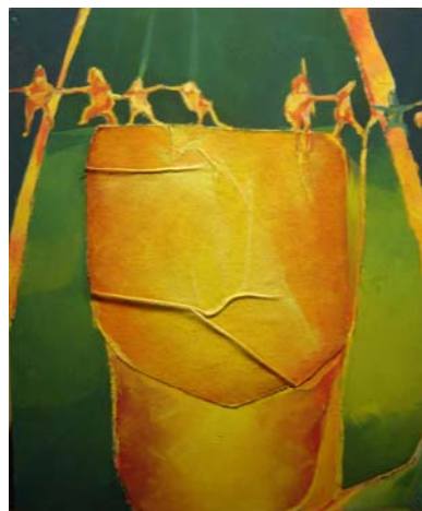
Medidas: 55x45,5cm, ano 77/78, vertical. Técnica: óleo sobre tela e colagem. Linguagem: Pintura.