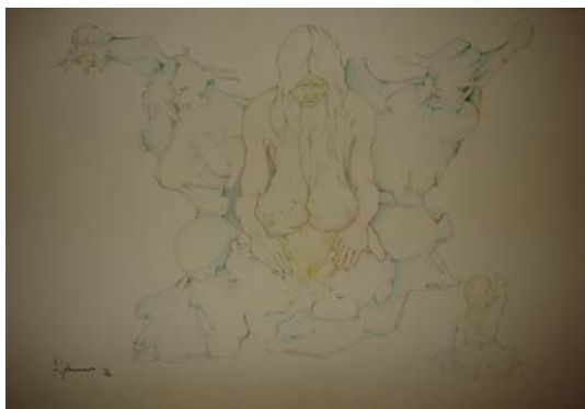
Desenho realizado para o Salão de Artes Plásticas de Alegrete. Medidas: 34,5x51cm, ano 1976, horizontal. Técnica: Mista (Grafite e Ecoline) sobre papel. Linguagem: Desenho.